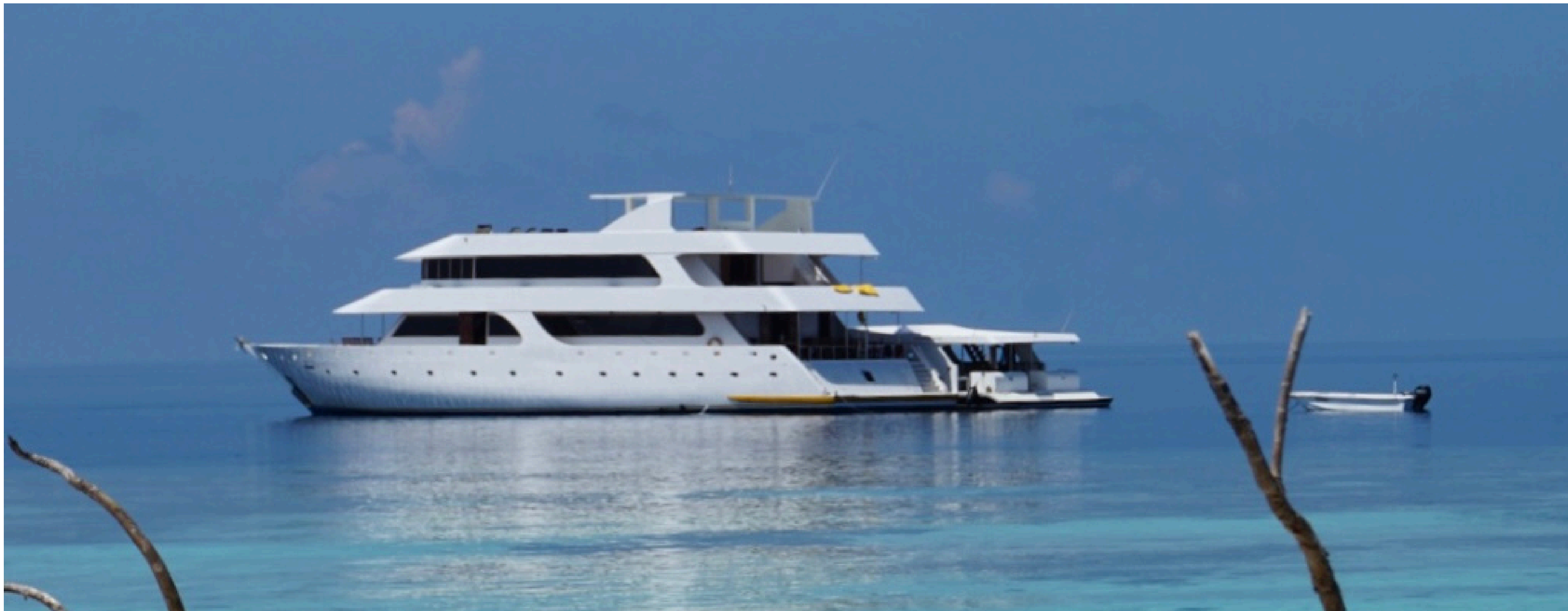
PRINCESS RANI nuestra casa durante la experiencia