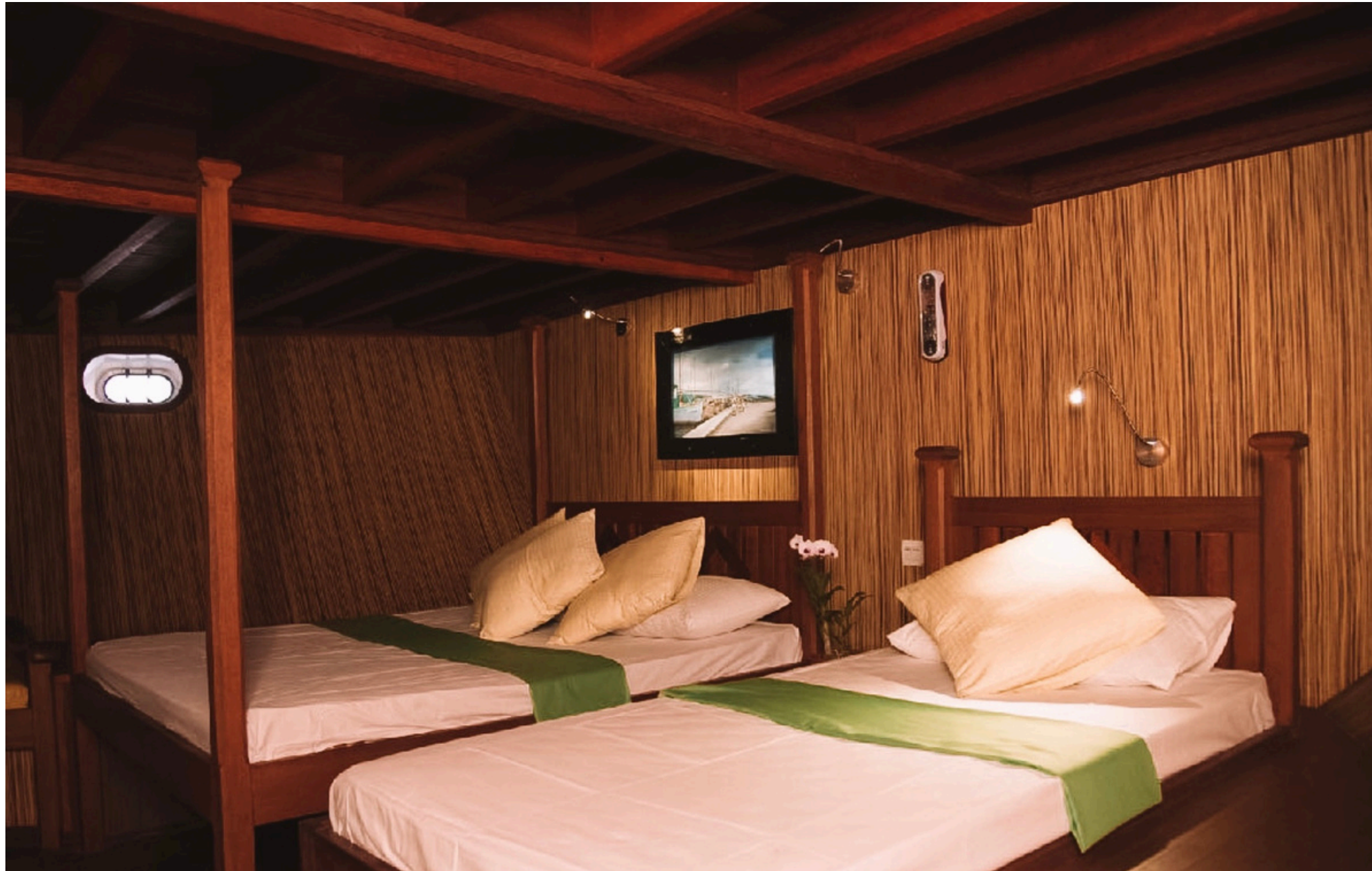
Habitación doble estándar con baño privado