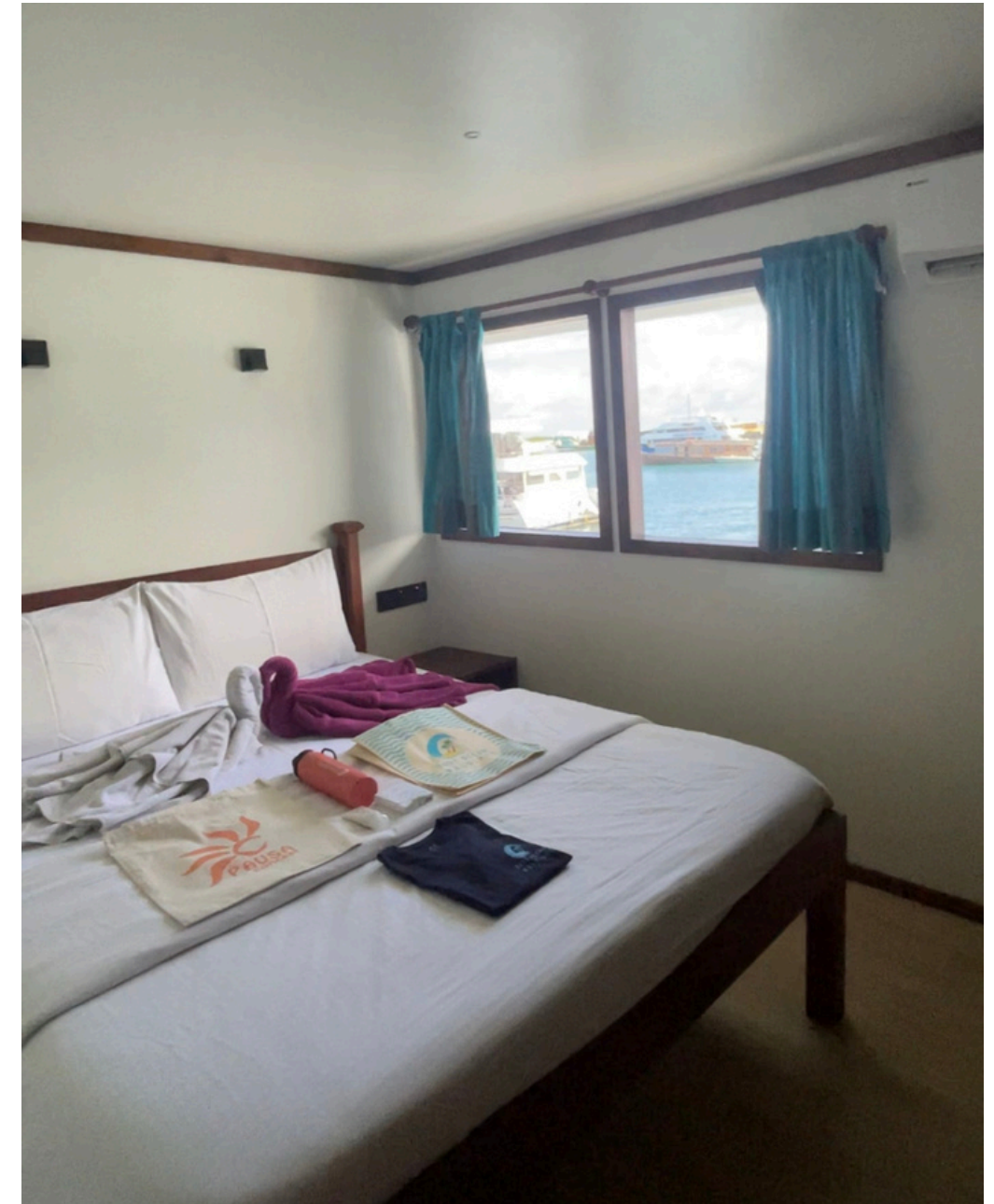
Habitación doble suite con baño privado, reformada con ventanas grandes